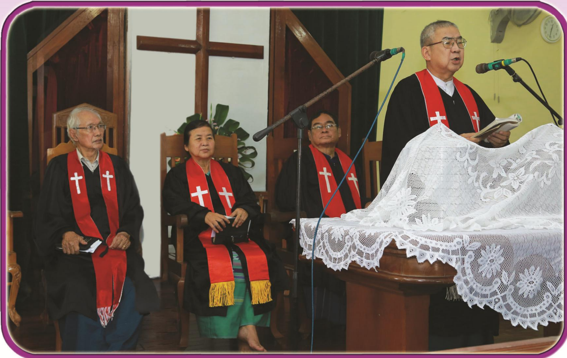
ဟီၣ်ခိၣ်ဒီဖျာၣ်ဘုၣ်မုၢ်န့ၤ - အိးကထိဘဉ်(၇)သီ